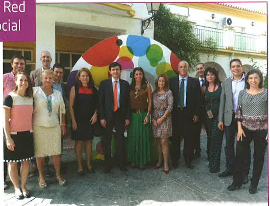
Primer encuentro de la Red Española de Innovación Social